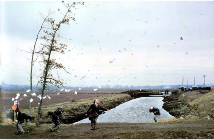
Jeff Wall. A Sudden Gust of Wind (After Hokusai) . 1993.