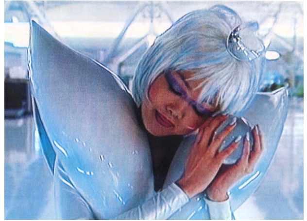
Mariko Mori. Minoko Inori . 1996.

En sus video instalaciones, Neshat presenta, en general, los universos femenino y masculino encarnados por individuos o grupos de mujeres u hombres, respectivamente, resaltando las diferencias culturales, sociales y religiosas que los separan. Dos proyecciones enfrentadas muestran la oposición de los grupos, acompañados por una banda sonora en la que suelen estar ausentes las palabras. En Rapture (1999), una de las proyecciones muestra a un conjunto de hombres ingresando a un fortín mientras, a lo lejos, un grupo de mujeres corren hacia una barca y se aventuran en el mar. Turbulent (1998), la video instalación con la que ganó un premio en la Bienal de Venecia de 1999, muestra en una pantalla a un hombre que canta frente a una multitud que lo ovaciona, mientras en la pantalla de enfrente, una mujer emite sonidos guturales en el escenario de un teatro vacío. Aquí, el hombre aparece como el poseedor de la palabra, secundado por el respaldo de sus compañeros vestidos, al igual que él, con camisas blancas. La mujer, cubierta en su túnica negra, sólo puede expresarse en la soledad. Sin embargo, a través de ella parecieran surgir otras voces. Buceando un poco en las leyes iraníes sabemos que ha ganado una batalla, ya que tal código prohíbe a las mujeres las presentaciones públicas y, si bien el auditorio está vacío, su canto es proferido desde un escenario.